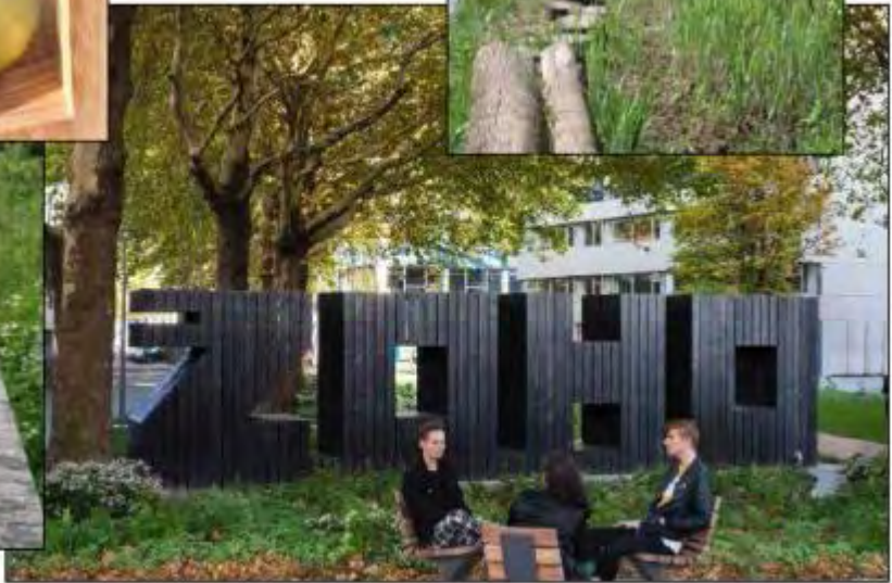
Referentiebeelden gewenste resultaat