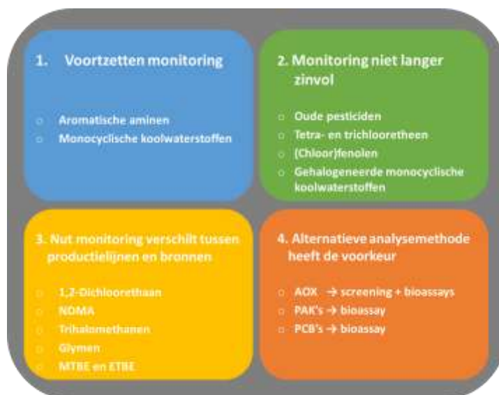
Afbeelding 2: Samenvatting van de uitkomst van de beoordeling van de stof(groepen) voor de productielijnen van Dunea, PWN en Waternet

Voor verschillende stofgroepen blijkt monitoring voor de DPW-bedrijven dus nog steeds nuttig te zijn (in ieder geval de stoffen uit categorie 1 en daarnaast een per productielijn wisselend aantal uit categorie 3). Sommige van deze stoffen worden wel in de bronnen aangetroffen maar niet in drinkwater en daardoor is, hoewel monitoring nuttig blijft, volgens de meetstrategie een reductie van de meetfrequentie in drinkwater verantwoord. Daarnaast is voor minimaal vier stofgroepen (categorie 2 en 3) monitoring niet langer nodig.