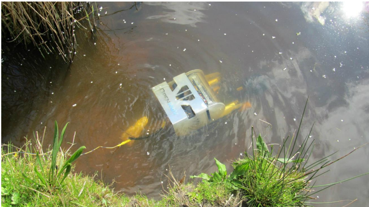
Afbeelding 2. Open ROV, Hogeschool Van Hall Larenstein (2016)

De bruikbaarheid en de verscheidenheid aan toepassingsmogelijkheden van onderwaterdrones zijn groot. Dit heeft ook invloed op de technologische ontwikkeling en het design van de drones zelf. Met veldwerk zijn waardevolle inzichten verkregen over praktische uitdagingen die zich voordeden tijdens het gebruik van onderwaterdrones voor milieukundige monitoring en andere toepassingen. Voorbeelden zijn flexibiliteit om de setup aan te passen aan andere omstandigheden en eisen, zoals de installatie en uitwisselbaarheid van data tussen verschillende sensoren en apparatuur. Maar ook bescherming van de propellers tegen vegetatie, goede manoeuvreerbaarheid om gegevens te verzamelen (systematisch afvaren van een route op een constante snelheid), eenvoudige reparaties, transport, behoefte aan accurate positionering en waterbestendige apparatuur zijn nog uitdagingen. Een succesvol ontwerp van een onderwaterdrone moet voldoen aan een aantal voorwaarden. Niet alleen is een duidelijke omschrijving van de functie waarvoor deze is ontworpen van belang (bijvoorbeeld waterkwaliteitsmonitoring, watermonsters, visuele inspecties). Maar ook de fysieke structuur, (meestal kubus- of cilindervormig), het drijfmechanisme (bijvoorbeeld met drijvers of geautomatiseerde ballasttanks), energieverbruik, voorstuwingsmethode (verticale/horizontale propellers). Tot slot zijn vaardigheden noodzakelijk voor de sturing, controle en digitale communicatie van de drone en de verschillende sensoren.