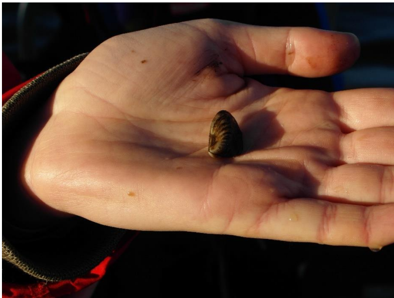
Afbeelding 1. De quaggamossel

Het lijkt er op dat de quaggamossel zich relatief ongestoord explosief ontwikkelt en een ecologische niche in de Nederlandse wateren heeft gevonden. De nieuwkomer begint grote oppervlakken van meren en plassen te bedekken. Daarom bestaat grote behoefte aan vlakdekkende informatie over de aanwezigheid van de quaggamossel in Rijnland. Enerzijds om de actuele verspreiding in beeld te brengen. Anderzijds om begrip te krijgen van de potentiële filtercapaciteit van de quaggamossel en zo te bepalen of deze mosselen inderdaad verantwoordelijk zijn voor de helderheid van het water.