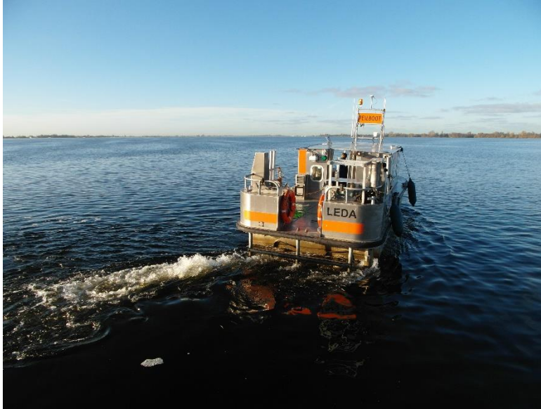
Afbeelding 3. De sonarpeilboot in actie

De SSS hangt naast het meetvaartuig en wordt door het water getrokken. De sonar zendt en ontvangt meerdere malen per seconde een hoogfrequent akoestisch pulssignaal. Door de intensiteit van het signaal af te beelden als functie van de plaats, zijn verschillende reflectieklassen te onderscheiden.