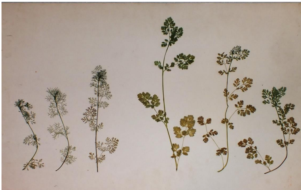
Afbeelding 1. Ontwikkeling van Koriander zonder (links) en met flowformbehandeling (rechts) van het kweekwater (uit [11])

Naast de populatiesamenstelling en –ontwikkeling is biologisch onderzoek aan afzonderlijke individuen van flora en fauna een belangrijk hulpmiddel om biotische responses te bepalen. Vooral jonge, zich snel ontwikkelende individuen zijn gevoelig voor versturende invloeden. Kiemproeven met plantenzaden zijn betrekkelijk eenvoudig en snel uit te voeren bioassays, waarmee veel ervaring bestaat. In dit verband worden resultaten getoond uit de ontwikkeling en beproeving van de flowforms, zoals te zien in de afbeeldingen 1, 2 en 3 [11].