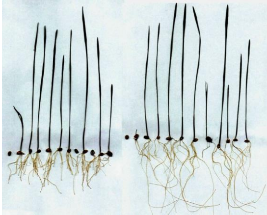
Afbeelding 2. Gekiemde tarwe in resp. onbehandeld (links) en flowform-behandeld (rechts) water (uit [11])