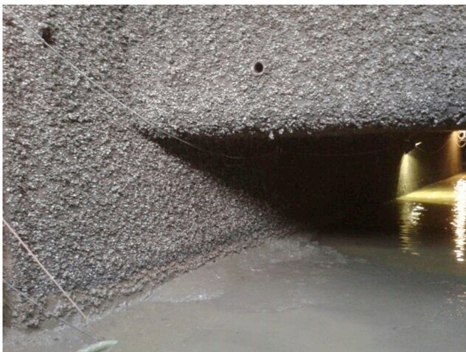
Afbeelding 2. Aankleving van Quaggamosselen bij het boezemgemaal Gouda

De aanwezigheid van quaggamosselen heeft niet alleen gevolgen voor de waterkwaliteit, maar ook voor het beheer en onderhoud van infrastructuur. Quaggamosselen hechten zich aan harde oppervlakten, zoals wanden van voertuigen, steigers en duikers. Het verwijderen van mosselen en het vervangen van infrastructuur leidt in Noord-Amerika tot hoge kosten voor recreanten, bedrijven en overheden. Voor Nederland is niet bekend tot welke kosten aangroei van mosselen tot nu toe heeft geleid. Wel is duidelijk dat door een verdere expansie van de quaggamossel dit voor waterbeheerders een opkomend risico vormt [6]. HHR heeft recente beelden van aankleving van quaggamosselen op kunstwerken. Gebiedsbeheerders geven aan er nog geen overlast van te ondervinden. Drinkwaterbedrijf Evides neemt maatregelen en zet onder andere chemicaliën in zoals chloorbleekloog om dichtgroei van transportleidingen te voorkomen [14].