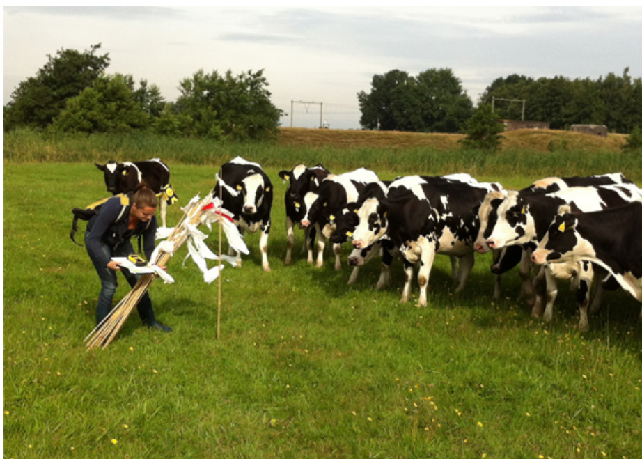
Afbeelding 1. Boorgaten worden gemarkeerd met tonkinstokken onder bekijks van jongvee