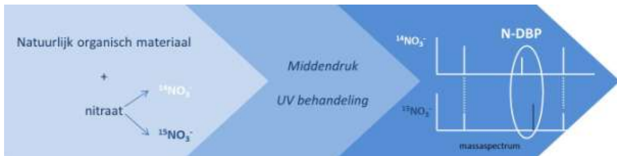
Afbeelding 2: opzet stikstoflabeling-experiment

Om lage concentraties van gevormde stikstofhoudende bijproducten te analyseren, zijn concentratie en monstervoorbehandeling middels vaste fase-extractie (SPE) toegepast. Vervolgens is met behulp van LC-HR-MS een brede screening [8] uitgevoerd op de watermonsters. Met behulp van HR-MS kan de brutoformule van een stof worden bepaald op basis van de accurate massa van een component en kunnen onbekende componenten worden geïdentificeerd.