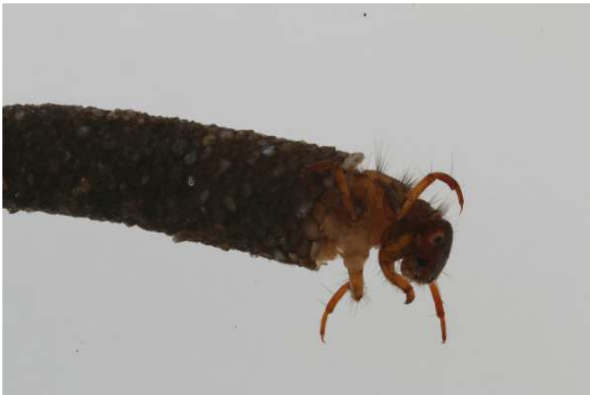
Afbeelding2: Larve van de kokerjuffer Lepidostoma basale . (foto Dorine Dekkers)

Na toetsing van de geschiktheid van het beekstelsel aan de hand van een habitatgeschiktheidsmodel, werd gezocht naar een geschikte bronpopulatie, waar zonder deze te beïnvloeden exemplaren verzameld konden worden. Daarna volgde veld- en laboratoriumonderzoek waarin onder andere is bekeken hoe de dieren zich gedragen in hun nieuwe levensgemeenschap en hoe ze het beste verplaatst en uitgezet konden worden [5]. Uiteindelijk werden op woensdag 12 maart 2014 2.400 larven uitgezet op één plek in de beek (afbeelding3). De larven werden bewust uitgezet op één locatie, zodat later gevolgd kon worden hoe de dieren zich in de tijd over de beek verspreiden.