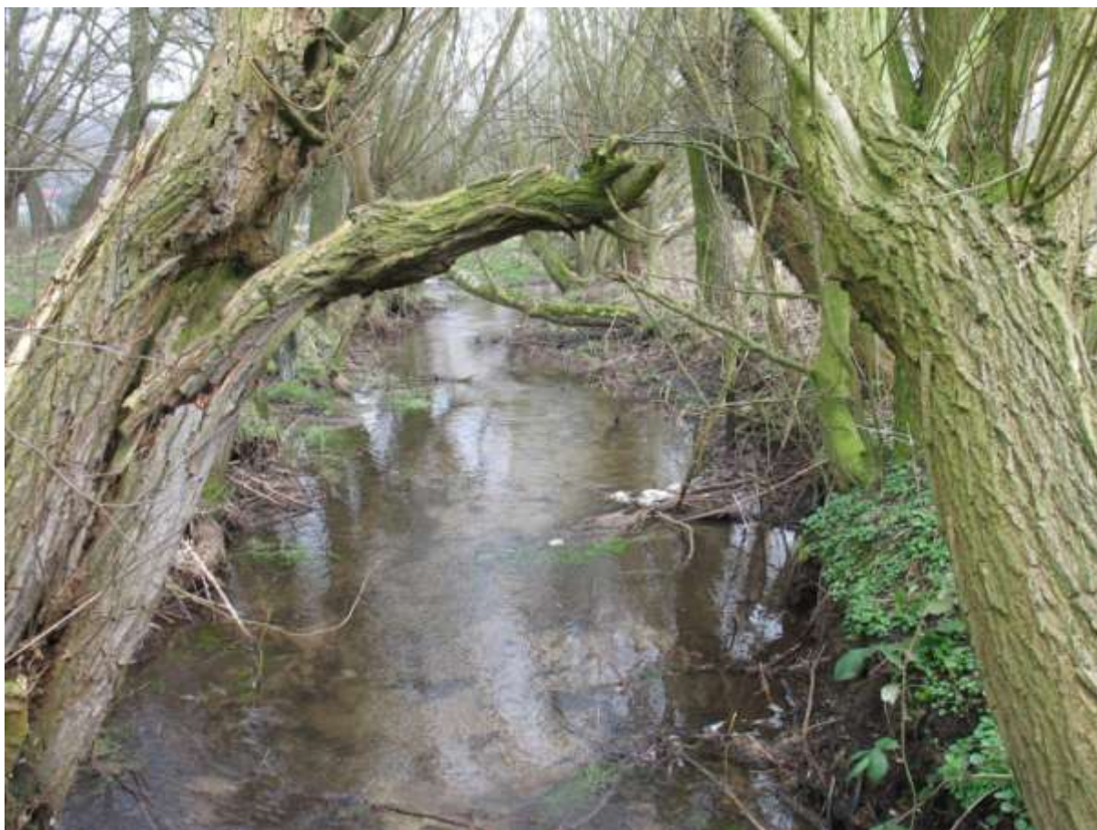
Afbeelding1: De Heelsumse beek op de zuid-Veluwe.

Biodiversiteit heeft dus een belangrijke functie voor het bekecosysteem. De afwezigheid van soorten remt dan ook het herstel van de beek, zelfs wanneer alle drukfactoren zijn weggenomen door herstelmaatregelen. Deze soorten komen niet zomaar weer terug. Dat was dan ook de aanleiding om in het kader van het kennisnetwerk Ontwikkeling en Beheer Natuurkwaliteit (OBN) ervaring op te doen met het uitzetten van functioneel belangrijke soorten macrofauna in herstelde beeksystemen [5]. In dit artikel worden de eerste ervaringen besproken met deze voor het Nederlandse waterbeheer nieuwe aanpak aan de hand van een casestudie: het introduceren van larven van de kokerjuffer Lepidostoma basale in de Heelsumse beek op de Veluwe.