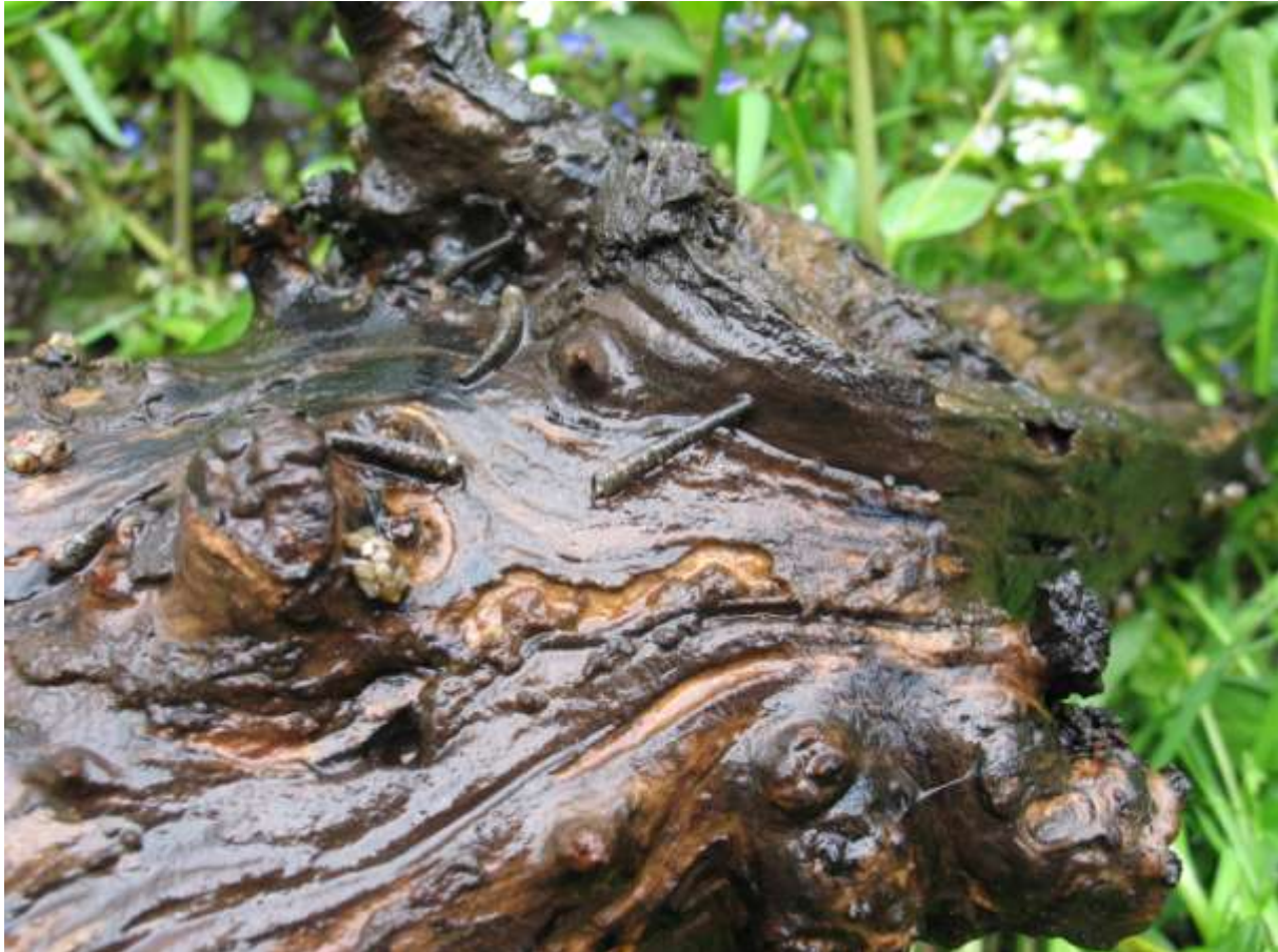
Afbeelding5: Succesvolle voortplanting vastgesteld! Een stuk hout met hierop larven van de soort.

Zowel boven- als benedenstrooms van het traject met larven waren geschikte substraten aanwezig, grofweg over een totale beeklengte van 1,2 kilometer, maar hier werd de soort tijdens de bemonstering niet aangetroffen. De waarnemingen lijken dus inzicht te geven in de actieradius van de soort. Het meest waarschijnlijk is dat de volwassen dieren de beek hebben gevolgd in zowel stroomopwaartse als stroomafwaartse richting en op geschikte plekken eieren hebben afgezet. De verst gelegen punten geven hierbij grofweg het maximale bereik van de dieren aan. Echter, we kunnen niet uitsluiten dat (een deel van) de verspreiding het gevolg is van verplaatsingen van de larven. Het lokaliseren van de volwassen dieren was net zoals in 2014 niet succesvol. In totaal werden 16 soorten kokerjuffers gevangen in de lichtvallen of in de netvangsten, maar volwassen L. basale werden niet aangetroffen, ondanks dat er gevangen werd in de hoofdvliegtijd van de soort. Waarschijnlijk is de trefkans door de geringe populatieomvang nog te klein om succesvol volwassen dieren te kunnen verzamelen.