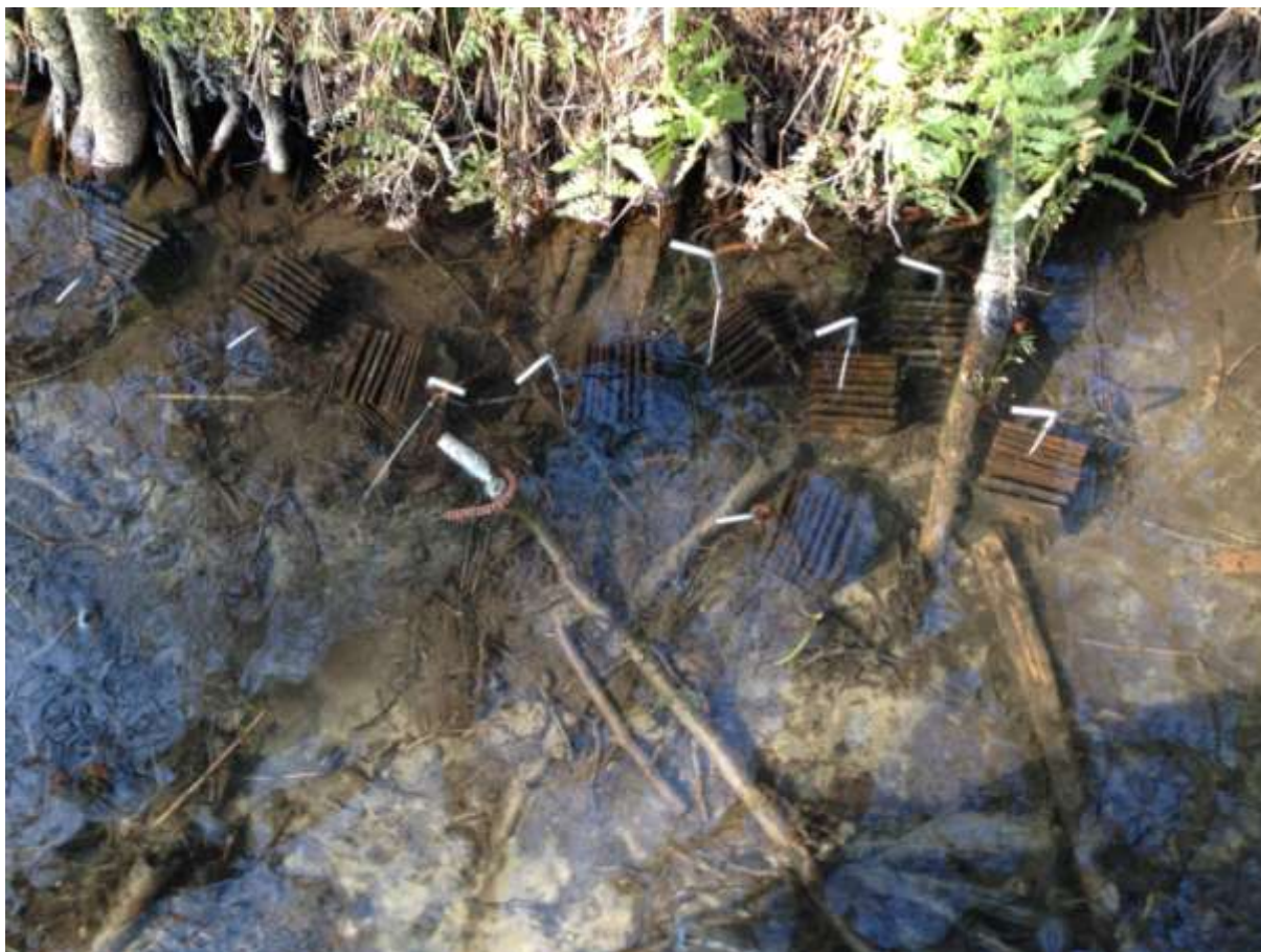
Afbeelding3: Kunstmatige substraten met kokerjuffers op de uitzetlocatie.

Om vast te stellen of de soort zich ook daadwerkelijk in de beek had kunnen handhaven en zich had voortgeplant, werd in de periode mei-juli 2015 de beek, inclusief de aanliggende beeksystemen, onderzocht op de aanwezigheid van de kokerjuffer (afbeelding 4). Hiervoor werden geschikte substraten in de Heelsumse beek, Renkumse beek en Seelbeek stelselmatig afgezocht op de aanwezigheid van larven of poppen. Het startpunt van de inventarisatie was de bovenloop, het eindpunt de monding van de beek in de Nederrijn. Alleen losliggende stenen en stukken hout in de beekloop werden onderzocht; vastzittende structuren, zoals wortels, konden niet bekeken worden. Wanneer de soort werd aangetroffen, werden de coördinaten van de vondst vastgelegd en het stadium, aantal exemplaren, type substraat en substraatdiameter genoteerd. Daarnaast werd met behulp van lichtvallen een inventarisatie uitgevoerd van de volwassen dieren. Hiervoor werden voor dit doel aangepaste 12 Volts BG-Sentineltraps (Biogents, Regensburg) met ultraviolet licht (8 Watt) gebruikt, die langs de oevers van de beken werden geplaatst op 9 locaties en 24 uur simultaan operationeel waren (afbeelding 4). In deze vallen konden de dieren levend verzameld worden. De lichtvalvangsten werden aangevuld met netvangsten door overdag systematisch oeverhabitats af te zoeken langs de Heelsumse beek, zoals de ruige vegetatie langs de beek, boven het water hangende boomtakken en -stammen en steile kanten.