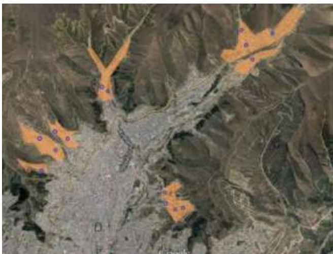
Afbeelding 4. Locaties in Chuquiaguillo met lage bevolkingsdichtheid

Condominial is een beschrijving voor een systeem van pijpleidingen dat anders is aangelegd dan conventionele systemen, om pijpleidingmeters te besparen in minder dichtbevolkte gebieden. Condominiale systemen vragen om medewerking van de bewoners; de pijpleidingen moeten zo effectief mogelijk gebouwd worden, wat soms minder sociaal wenselijk kan uitpakken voor bepaalde bewoners. Als het buurtgevoel sterk is, dan kan dit worden overwonnen.