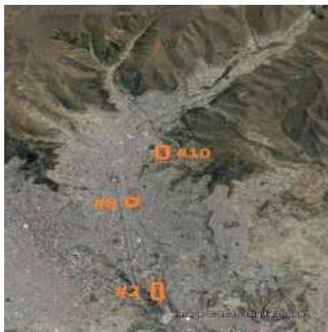
Afbeelding 3. Het stroomgebied van de Orkojahaira met de voorgestelde locaties voor decentrale zuivering (bron: Google Earth, locaties ingetekend)

Op locatie 10 zou een primaire sedimentatie (eventueel met dosering van chemicaliën) effectief zijn. Op de locaties 8 en 2 kan gedacht worden aan een grote Imhofftank als voorbehandeling of een Upflow Anaerobic Sludge Blanket (UASB). De keuze tussen UASB of grote Imhofftank hangt af van de beschikbare fondsen en van kennis en capaciteit van de lokale watertechnologen. Nadat het water gedeeltelijk is gezuiverd, kan de natuurlijke werking van de cascades in de rivier een goedkope nazuivering bieden.