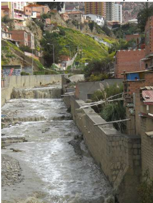
Afbeelding 2. Geïmproviseerde pijpleidingen voor afvoer van afvalwater in La Paz, Bolivia

In Chuquiaguillo zijn lang niet alle huizen aangesloten op het riool. Veel inwoners bouwen zelf geïmproviseerde pijpleidingen die uitkomen op straat, op kleine riviertjes of op het regenwatersysteem (zie afbeelding 2). Mede hierdoor is het ‘gescheiden’ netwerk in de praktijk niet echt gescheiden. Ook de straat en kleine riviertjes komen uiteindelijk uit op een van de zeven grote rivieren in La Paz.