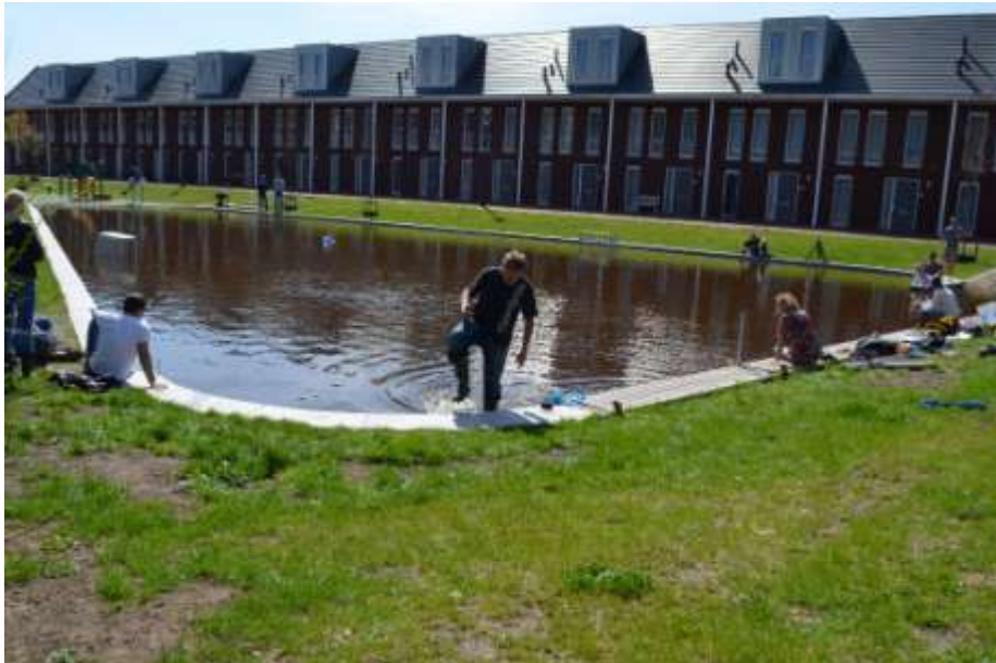
Afbeelding 1. Het waterplein in 's-Hertogenbosch tijdens de full scale test

De werking van het waterplein tijdens zware regenval is verbeeld in afbeelding 2. Bij droog weer of kleine buien is het plein niet anders dan alle andere pleinen. Bij hevige regen kan het tot circa 40 cm volstromen. Het regenwater van de wijk wordt met leidingen ondergronds verzameld. Bij kleine buien stroomt het rechtstreeks naar de Aa. De afvoercapaciteit langs deze weg is beperkt door een wervelventiel in de leiding. Bij hevige regen stuwt het water door de knijpende werking het wervelventiel op en stroomt daardoor via putten in het plein. Het plein is verdeeld in 3 vlakken, met steeds 3 cm hoogteverschil. Eerst stroomt het laagste deel vol, bij meer regen stromen het tweede en derde deel ook vol. Het plein is zodanig ontworpen dat het gemiddeld vijf maal per jaar water bergt. Over de volle breedte is een overloop gemaakt onder de banken. Als de berging op het plein geheel gevuld is, stroomt het extra water direct en zonder beperkingen naar de rivier de Aa via deze overloop.