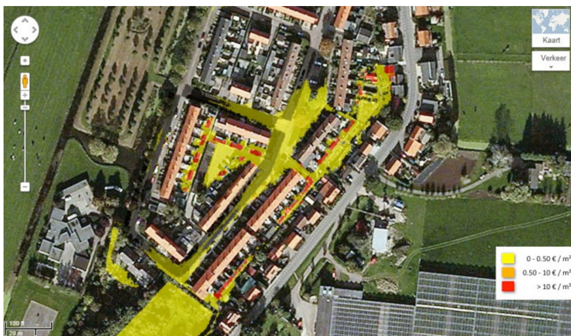
Afbeelding 3. Voorbeeld van een schadekaart. In deze wijk treedt vooral schade op aan de schuurtjes tussen de huizenblokken.

De uitgebreide berekeningen zijn vooral bedoeld voor de gevorderde gebruiker, die geïnteresseerd is in de baten van maatregelen. Met de schade van een enkele gebeurtenis kunnen namelijk geen baten bepaald worden. Voor het bepalen van de baten moet namelijk naast de schade ook de kans op deze wateroverlast worden meegenomen. In de WaterSchadeCalculator kunnen hiervoor met meerdere schadekaarten risico- en batenberekeningen worden uitgevoerd.